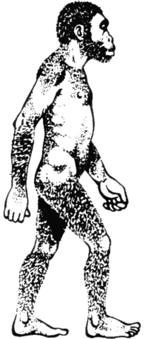
Illustration Stéphane SERRE, Histoire d'Ancêtres , D. GRIMAUD-HERVE, F. SERRE, J.-J. BAHAIN, éd. Artcom', Paris, 1998.